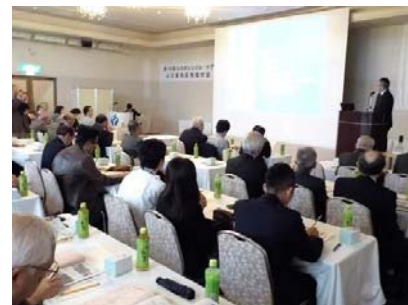
地域説明会の風景

周南地区環境保全協会に加盟する企業と合同で説明会を準備及び運営し、地元住民の方々にご理解して頂きました。