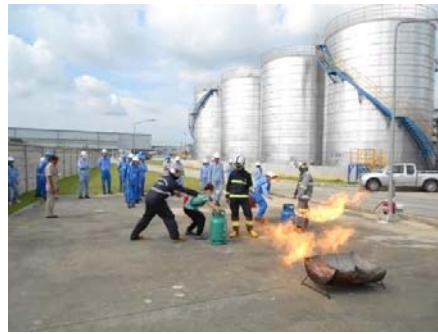
NIPPON SEIRO(THAILAND) CO.,LTD.

2016年度は、徳山工場では、2月19日と11月25日の2回、また NIPPON SEIRO(THAILAND) CO.,LTD.では、10月10日に社内総合防災訓練を実施しました。