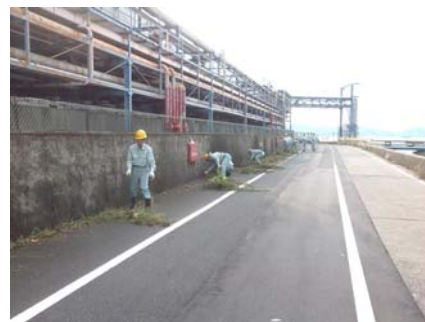
工場周辺県道草刈り