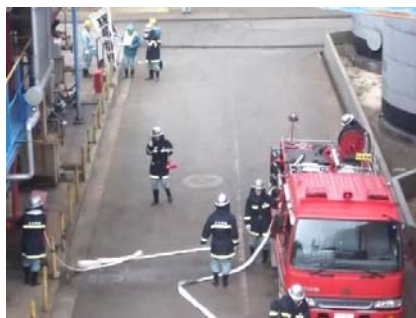
徳山工場総合防災訓練