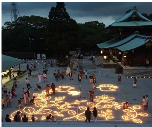
遠石八幡宮境内を照らす手作りキャンドル

周南市の遠石八幡宮で毎年行われる「キャンドルナイト in といしの杜」にキャンドルの原料であるパラフィンワックスを提供しています。2016年度は、12回目を迎え、去る9月22日(木)に開催されました。当社は、原料提供のみならず、エコ活動に対して積極的に協力しています。