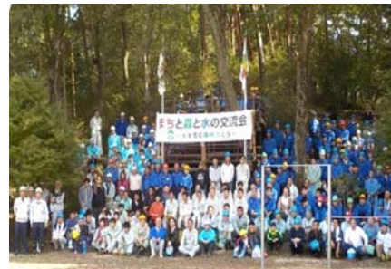
まちと森と水の交流会

また、2016年度は雨天の為中止となりましたが、毎年、「3000万人瀬戸内海クリーン大作戦」に参加しています。