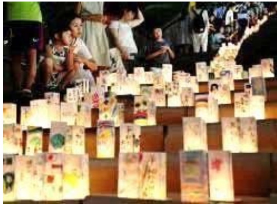
平和を願って灯されたキャンドル

長崎「平和の灯」HP： http://nagasakipeace.jp/japanese/peace/action/events/tomoshihi.html